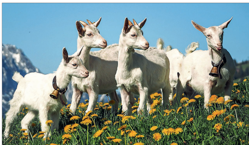
Lebensfreude pur strahlen die jungen «Gibeni» aus Mannried in den Remissere oberhalb von Saanenmöser aus – eines der 48 Tierbilder in Maria Rieders Bilderbuch vom Bauernhof.

Mein Sohn Tim schuf ein wunderschönes CD-Grafikdesign. Pünktlich zu Weihnachten wird das Album veröffentlicht. Dies in einem Jahr, das wir alle wohl nicht so schnell vergessen werden. Mit diesen Liedern wünsche ich euch viel Hoffnung für das kommende Jahr.