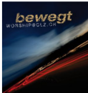
Artnr. 585522; Preis 29.80 CHF