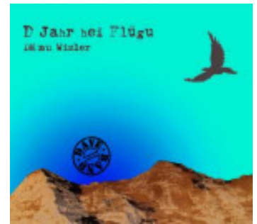
Artnr. 585523; Preis 25.00 CHF